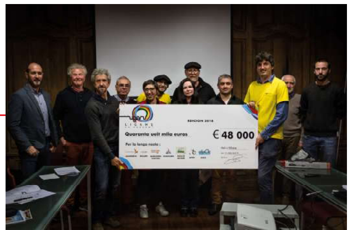
Remise des chèques aux porteurs des projets financés édition 2018